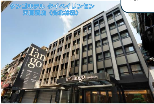
タンゴホテル タイペイリンセン 天閣酒店 (台北林森)