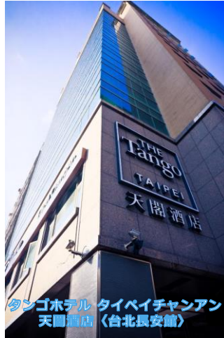
タンゴホテル タイペイチャンアン 天閣酒店 (台北長安館)

林森北路沿いに建つスタイリッシュなデザインホテル。市街地の中山区に位置し、客室は明るくモダンなインテリアでワークデスクが設置され最新機器や無料Wi-Fi接続など便利なアメニティが揃っている。