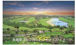
美麗華ゴルフクラブ/イメージ